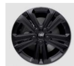
16"-os fekete könnyűfém felni