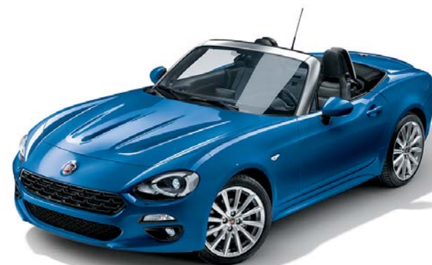
5CC DYNAMIC KÉK - METÁLFÉNYEZÉS