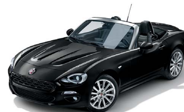
5DN JET FEKETE - METÁLFÉNYEZÉS