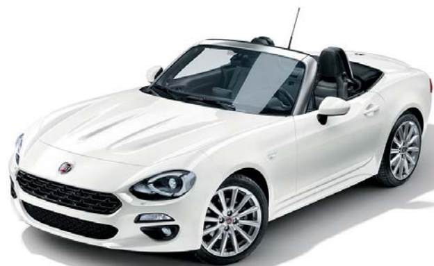
5CB ARCTIC FEHÉR - PASZTELLSZÍN