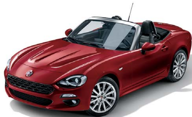
5CA PASSIONE PIROS - PASZTELLSZÍN

AZ ÚJ FIAT 124 SPIDER MINDEN EGYES RÉSZLETÉT ÚGY TERVEZTÜK, HOGY ERŐTELJES HATÁST GYAKOROLJON ÖNRE. EZ A BRILLIÁNS ROADSTER NYOLC KÜLÖNBÖZŐ SZÍNBEN ÉS 16" VAGY 17"-OS KÖNNYŰFÉM KERÉKTÁRCSÁKKAL RENDELHETŐ. ÖRÖM A SZEMNEK RÁNÉZNI, ÁM A 124 SPIDER BELTERÉNEK RÉSZLETEI MÉG CSÁBÍTÓBBAK. A LUSO KIVITEL BŐRÜLÉSEI LEHETNEK FEKETE, VAGY DOHÁNY SZÍNŰEK. VÁLASSZON KÖZÜLÜK, ÉS MUTASSA MEG SAJÁT SZEMÉLYISÉGÉT A VILÁGNAK.