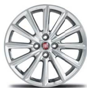
17" OS KÖNNYŰFÉM KERÉKTÁRCSÁK (LUSSO)