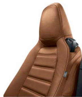
470 - SÁRGÁSBARNA BŐRKÁRPIT (LUSSO)