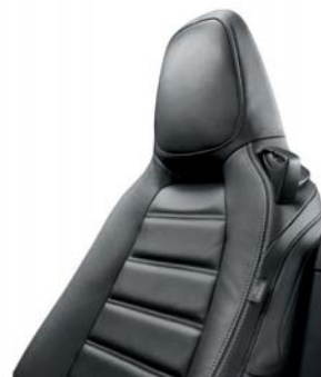
404 - FEKETE BŐRKÁRPIT (LUSSO)