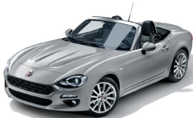
5CD ALUMINIUM EZÜST - METÁLFÉNYEZÉS