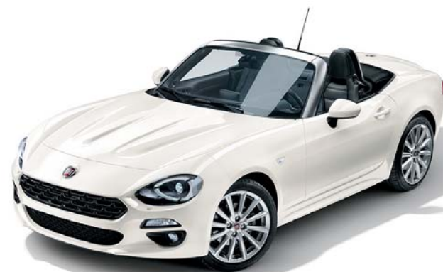
802 CRYSTAL FEHÉR - GYÖNGYHÁZFÉNYEZÉS