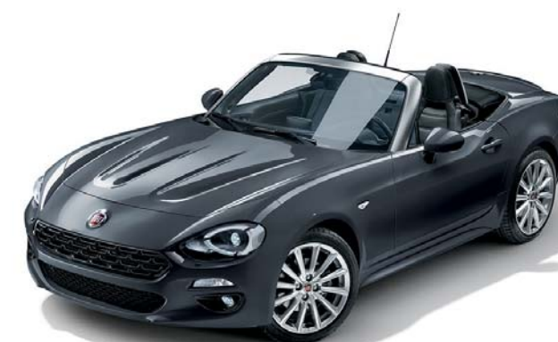
5CE METEOR SZÜRKE - METÁLFÉNYEZÉS