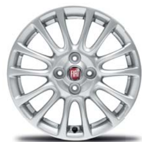
16" KERÉKTÁRCSÁK (124 SPIDER)